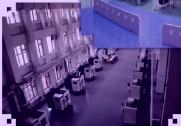
DMG 数控技术训练场所