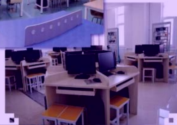
一体化课程教学设计综合实训室