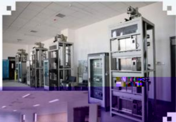
智能电梯安装调试维护训练场所